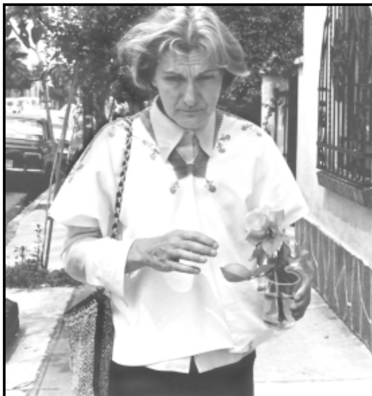
De casa en casa con su bolso al hombro. México, 1975